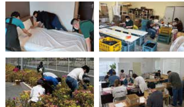
※写真は仕事の一部です

施設内及び施設外での作業体験を通じて、作業の理解力や遂行能力、コミュニケーション能力、判断力、態度などの自己理解を評価して今後の進路を関係機関の方々と一緒に考えていきます。